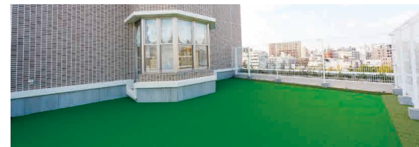
バッティング練習場 美しい眺めを見ながらバッティング